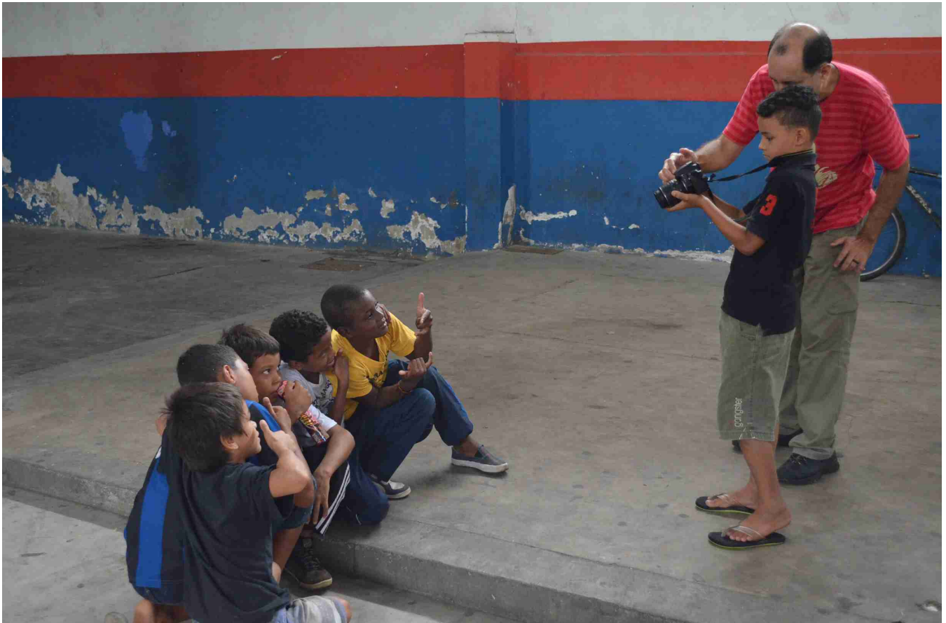
Garoto do grupo de capoeira, nosso fotógrafo mirim.